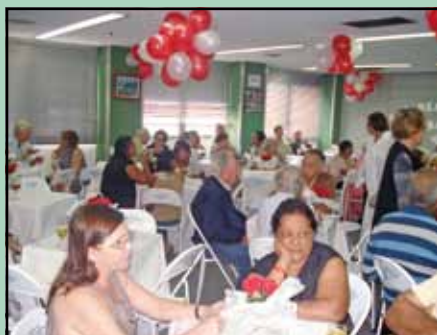
Associados se reúnem em mais uma festa. Evento contou com cerca de 200 convidados