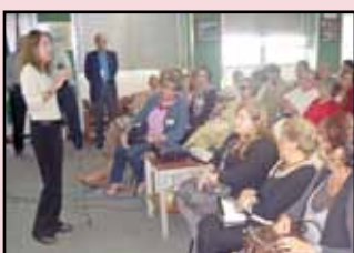
Associados recebem dicas de como manter uma postura corporal correta